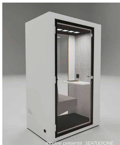
modèle présenté : SEAT001ONE