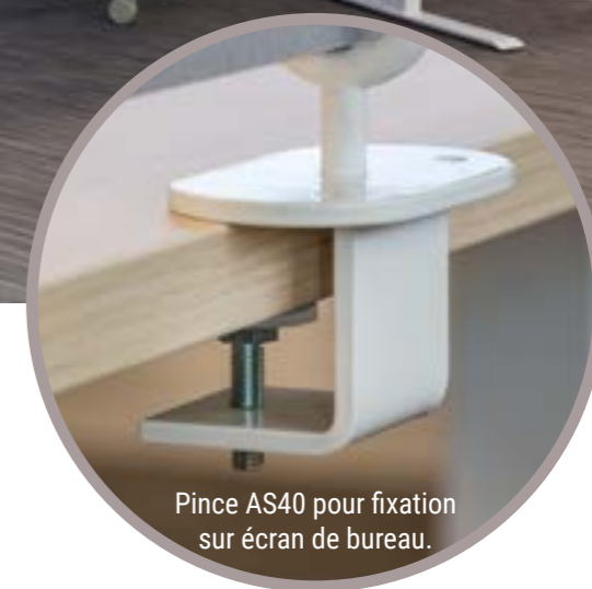
Pince AS40 pour fixation sur écran de bureau.