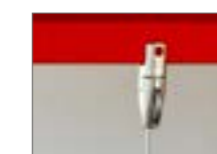
Fixation URBAN suspendue