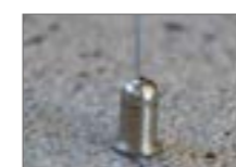
Fixation au sol et plafond